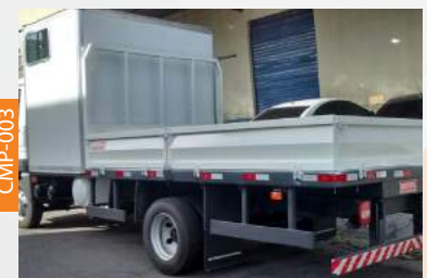
CARROCERIA METÁLICA PADRÃO