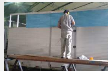
Reforma de Baú Corrugado: Aumentando a altura e o comprimento do baú.