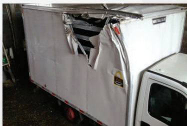
Reforma de Baú.