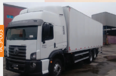
BAÚ CORRUGADO DE ALUMÍNIO