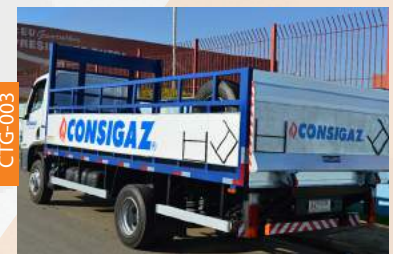
CARROCERIA P/ GÁS