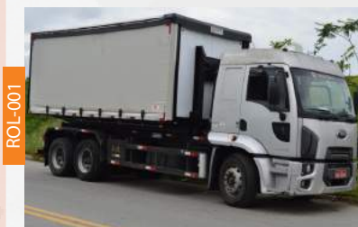
ROLL ON ROLL OFF COM EQUIPAMENTO PLATAFORMA LONADA PARA TRANSPORTE DE VEÍCULOS