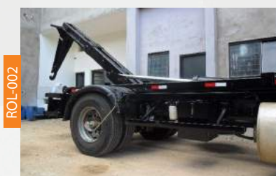
ROLL ON ROLL OFF