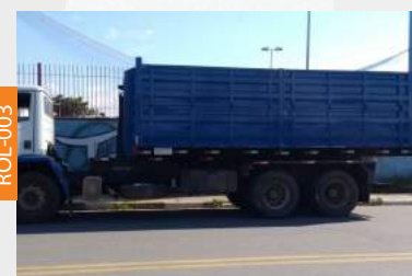
ROLL ON ROLL OFF COM EQUIPAMENTO CARROCERIA GUARDA DUPLA