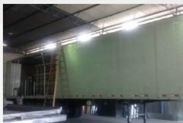
Reforma de Carreta: Reformamos todas as marcas.